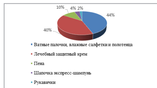
Рис. 2. Использование современных средств ухода

пахи выделений, тело после пены имеет приятный запах. Большинство ухаживающих дают высокую оценку лечебным защитным кремам, которые помогают не допустить различных изменений на коже тяжелобольного пациента.