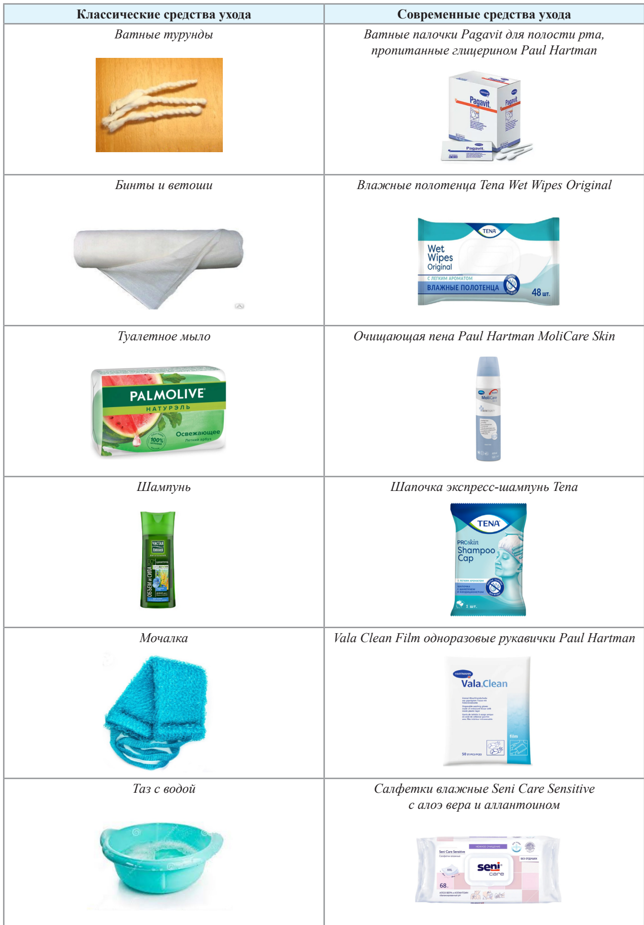
Таблица 1. Классические и современные средства ухода