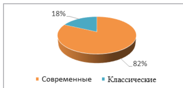
Рис. 1. Использование средств ухода