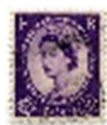
Нет названия страны: Убанги-Шари (1924)