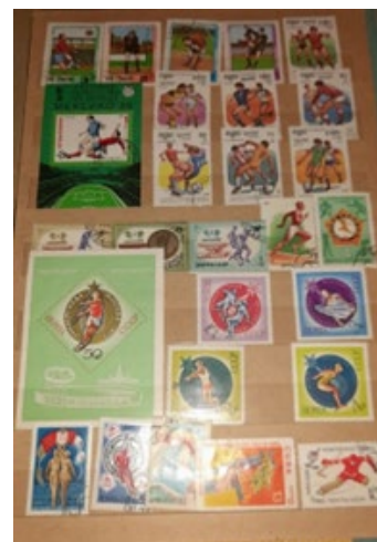
Первые папины марки в семейной коллекции