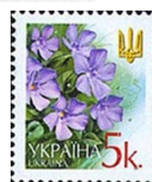
Название дублировано латиницей, эмблема страны в углу: Украина (2002)