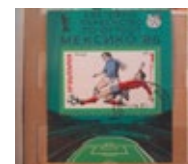
Марки в семейной коллекции