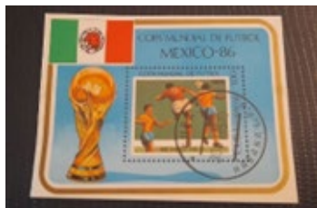
Copa mundial de futbol Mexico-86. 1985. Сувенирный лист Кубы. Copa mundial de futbol Mexico-86. 1 peso

Самой дорогой в коллекции считается марка Сувенирный лист Кубы не только по цене, но и по значимости. Она попала в коллекцию папы через тройной обмен и занимает первое место в ней.