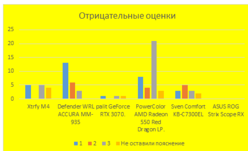
Диаграмма 1. Отрицательные оценки