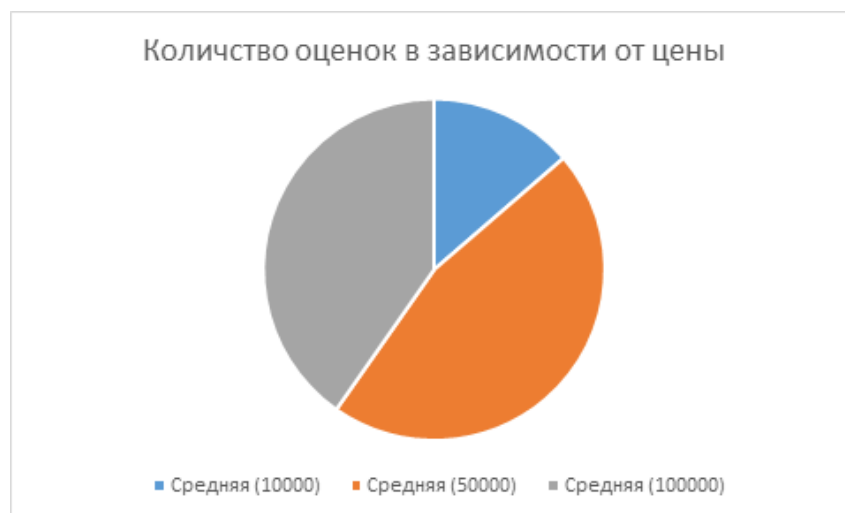
Диаграмма 4. Количество оценок в зависимости от цены