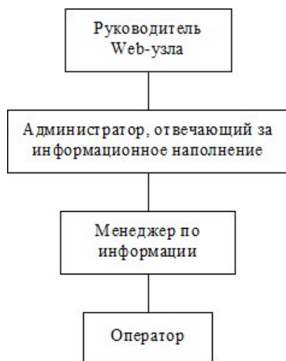
Рис. 2. Структура управления информационным отделом веб-узла

Структура управления информационным отделом веб-узла должна выглядеть так, как представлено на рис. 2: