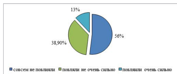
Рис. 1. Мнение студентов о том, повлияли ли на их образ жизни санкции против РФ

На вопрос о введенных против России санкциях 78% опрошенных ответили, что слышали о санкциях, 12% заявили, что не ожидали введения санкций, 7% утверждают, что санкции оказались не такими, как они ожидали, 2% ответили, что примерно совпали с их ожиданиями, и только 1% студентов ответили, что ничего не слышали о введенных санкциях, 56% студентов, принявших участие в опросе, считают, что экономические санкции совсем не повлияли лично на них и их образ жизни, 38,9% ответили, что санкции повлияли не очень сильно, а 13% ощутили сильное влияние санкций.