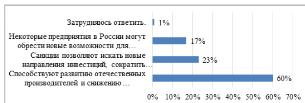
Рис. 3. Какие положительные последствия санкций оказываются на Россию, по мнению обучающихся

На вопрос, пойдут ли санкции России на пользу, 70% участников ответили положительно, соответственно, 30% выбрали отрицательный ответ. По мнению более половины респондентов, санкции способствуют развитию отечественных производителей и снижению зависимости от импорта, 23% уверены, что санкции позволяют искать новые направления инвестиций, сокращать риски, 17% считают, что некоторые предприятия в России могут обрести новые возможности для роста и развития, и только 1% затрудняются ответить.